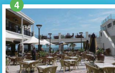
セント・キルダ メルボルン市内からすぐの人気ビーチ・エリア。ウォーキングやサイクリングを楽しむのはもちろん。ショッピングエリアとしても有名。毎週日曜日にはサンデーマーケットが開かれる。

Course ■ Marathon (42.195km) ■ Half Marathon (21.1km)