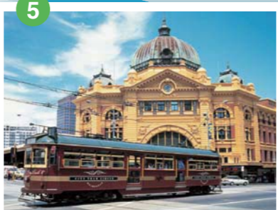
フリンドース・ストリート駅 1日25万人が利用するターミナル駅。1854年に国内初の駅として完成したエドワード王朝風の建築はメルボルンのシンボルとなっている

スタートは全豪オープンテニスの会場となるメルボルン・パーク・テニスセンター前。 1854年に国内初の駅として完成した英国風のフリンドース・ストリート駅を左折して、ヤラ川を越えると右側には文化の中心とも言える現代風のアート・センター、左側にはガーデンシティ・メルボルンを代表するアレクサンドラ・ガーデン、クイーン・ビクトリア・ガーデン、ロイヤル・ボタニック・ガーデンが続く。 新緑の街路樹が目鮮やかな通りを抜けると、やがてアルバート・レークが見えてくる。 F1 レースのコースにもなる湖周回コースを過ぎると、ポートフィリップ湾の海岸線に出る。ここが丁度15キロ地点。さわやかな海風に吹かれながら、開放感いっぱいのシーサイドロードを往復すると30キロ地点。ここからは、シティを目指して元来た道に戻るが、35キロからは行きに左手に見た英国風の公園を周回する。木々の緑が疲れた身体を癒やしてくれる。セントポールズ大聖堂を正面に見て右折すると40キロ。1956年のメルボルン・オリンピックに合わせて建造された10万人収容のメルボルン・クリケット・グラウンド(MCG)のフィニッシュ地点はもう目の前だ。