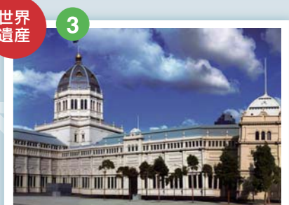
ロイヤル・エキシビジョン・ビルディング 1880年に万博展覧会のために建設された。19世紀に世界各地で開催された万博の歴史を伝える貴重な建造物として2004年にユネスコの世界文化遺産に登録された。