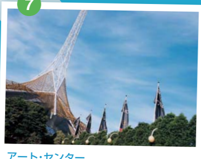
アート・センター 1982年にオープンした近代アートセンター。メルボルンの現代アートをリードする大型の公立施設。音楽、演劇などを上演するホールやシアター、スタジオがある舞台芸術施設。