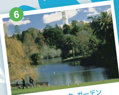
ロイヤル・ボタニック・ガーデン 1842年に造園された歴史ある英国式庭園。約40万㎡の敷地内には、1万2000種以上の植物が植えられ、50種類以上の野鳥が生息している。メルボルンを代表する植物園