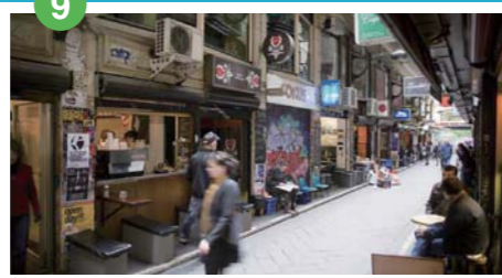
レーン・ウェイ (シティーのおしゃれな路地) カフェやレストラン、ショップが並び、メルボルンで最も活気があり、おしゃれなスポットとなっている。19世紀中～後期に作られたオーストラリアのカフェ文化が発祥した石畳の小径や19世紀建設のアーケードなど街探索におすすめ