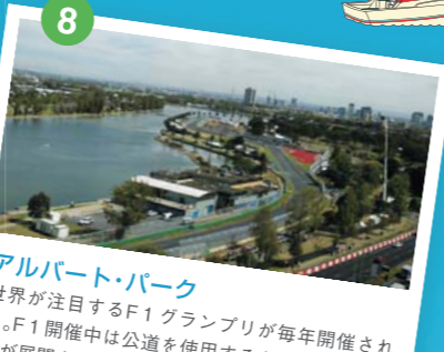
アルバート・パーク 世界が注目するF1グランプリが毎年開催される。F1開催中は公道を使用するため過酷なレースが展開される。