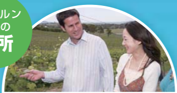
ヤラ・バレー 50以上のワイナリーが点在するオーストラリアを代表するワインカントリー。1837年に生産が始まり、名門とされるワイナリーも数多い。