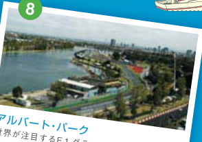
アルバート・パーク 世界が注目するF1グランプリが毎年開催される。F1開催中は公道を使用するため通常のレースが展開される。