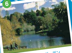
ロイヤル・ボタニック・ガーデン 1842年に造園された歴史ある英国式庭園。約40万㎡の敷地内には、1万2000種以上の植物が植えられ、50種類以上の野鳥が生息している。メルボルンを代表する植物園

スタートは全豪オープンテニスの会場となるメルボルン・パーク・テニスセンター前。 1854年に国内初の駅として完成した英国風のフリンドラス・ストリート駅前を左折して、ヤラ川を越えると右側には文化の中心とも言える現代風のアート・センター、左側にはガーデンシティ・メルボルンを代表するアレクサンドラ・ガーデン、クイーン・ビクトリア・ガーデン、ロイヤル・ボタニック・ガーデンが続く。 新緑の街路樹が目に見え、鮮やかな通りを抜けると、やがてアルバート・レークが見えてくる。 F1 レースのコースにもなる湖周回コースを過ぎると、ポートフィリップ湾の海岸線に出る。ここが丁度15キロ地点。さわやかな海風に吹かれながら、開放感いっぱいのシーサイドロードを往復すると30キロ地点。ここからは、シティを目指して元来た道に戻るが、35キロからは行きに左手に見た英国風の公園を周回する。木々の緑が疲れた身体を癒やしてくれる。セントポールズ大聖堂を正面に見て右折すると40キロ。1956年のメルボルン・オリンピックに合わせて建造された10万人収容のメルボルン・クリケット・グラウンド(MCG)のフィニッシュ地点はもう目の前だ。