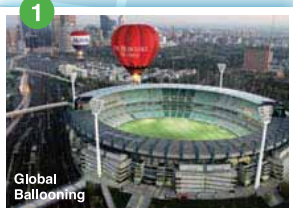
Global Ballooning メルボルン・クリケット・グラウンド(MCG) 1956年のメルボルンオリンピックに合わせ完成したクリケット競技場。ワールドカップ アジア最終予選で日本VSオーストラリア戦が行われたことでも知られている。