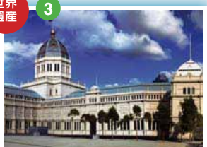
ロイヤル・エキシビジョン・ビルディング 1880年に万博覧会のために建設された。19世紀に世界各地で開催された万博の歴史を伝える貴重な建造物として2004年にユネスコの世界文化遺産に登録された。