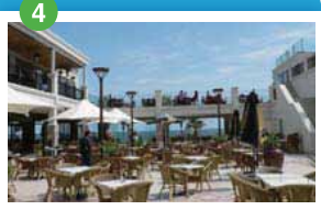
セント・キルダ メルボルン市内からすぐの人気ビーチ・エリアウォーキングやサイクリングを楽しむのももちろん。ショッピングエリアとしても有名。毎週日曜日にはサンデーマーケットが開かれる。

Course Marathon (42.195km) Half Marathon (21.1km)