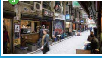
レーン・ウェイ (シティのおしゃれな路地) カフェやレストラン、ショップが並び、メルボルンで最も活気があり、おしゃれなスポットとなっている。19世紀中～後期に作られたオーストラリアのカフェ文化が発祥した石畳の小径や19世紀建設のアーケードなど街探案におすすめ