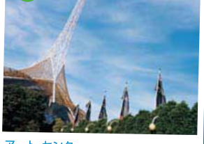
アート・センター 1982年にオープンした近代アートセンター。メルボルンの現代アートをリードする大型の公立施設音楽、演劇などを上演するホールやシアター、スタジオがある舞台芸術施設。