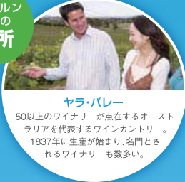
ヤラ・バレー 50以上のワイナリーが点在するオーストラリアを代表するワインカンントリー。1837年に生産が始まり、名門とされるワイナリーも数多い。