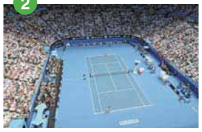
メルボルン・パーク ナショナル・テニスセンター テニス・グラウンドスラムの全豪オープンが開催され、世界各国から名プレイヤーやファンたちが集結する会場はシティから徒歩で15分の便利な立地