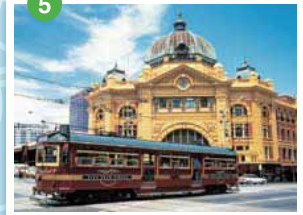
フリンドラス・ストリート駅 1日25万人が利用するターミナル駅。1854年に国内初の駅として完成したエドワード王朝風の建築はメルボルンのシンボルとなっている