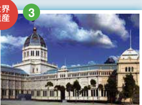
ロイヤル・エキシビジョン・ビルディング 1880年に万博覧会のために建設された。19世紀に世界各地で開催された万博の歴史を伝える貴重な建造物として2004年にユネスコの世界文化遺産に登録された。