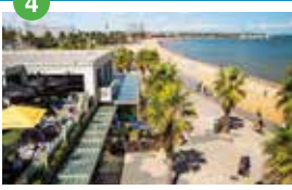
セント・キルダ メルボルン市内からすぐの人気ビーチ・エリア。ウォーキングやサイクリングを楽しむのももちろん。ショッピングエリアとしても有名。毎週日曜日にはサンデーマーケットが開かれる。

Course Marathon (42.195km) Half Marathon (21.1km)