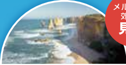
グレート・オーシャン・ロード

カフェやレストラン、ショップが並び、メルボルンで最も活気があり、おしゃれなスポットとなっている。19世紀中～後期に作られたオーストラリアのカフェ文化が発祥した石畳の小径や19世紀建設のアーケードなど街探索におすすめ