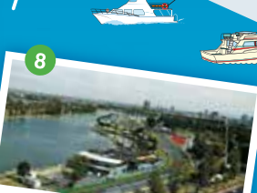
アルバート・パーク 世界が注目するF1グランプリが毎年開催される。F1開催中は公道を使用するため過酷なレースが展開される。