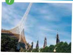
アート・センター 1982年にオープンした近代アートセンター。メルボルンの現代アートをリードする大型の公立施設。音楽、演劇などを上演するホールやシアター、スタジオがある舞台芸術施設。