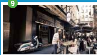
レーン・ウェイ (シティーのおしゃれな路地)

カフェやレストラン、ショップが並び、メルボルンで最も活気があり、おしゃれなスポットとなっている。19世紀中～後期に作られたオーストラリアのカフェ文化が発祥した石畳の小径や19世紀建設のアーケードなど街探索におすすめ