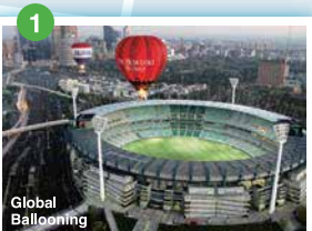
Global Ballooning メルボルン・クリケット・グラウンド(MCG) 1956年のメルボルンオリンピックに合わせて完成したクリケット競技場。ワールドカップアジア最終予選で日本VSオーストラリア戦が行われたことも知られている。