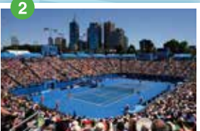
メルボルン・パーク ナショナル・テニスセンター テニス・グラウンドスラムの全豪オープンが開催され、世界各国から名プレーヤーやファンたちが集結する会場はシティから徒歩で15分の便利な立地